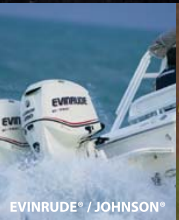
EVINRUDE® / JOHNSON®