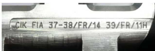
Maitre-cylindre / Master-cylinder