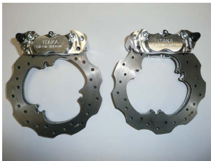
Photo du frein avant : étriers et disques seulement Photo of front brake: calipers and discs only